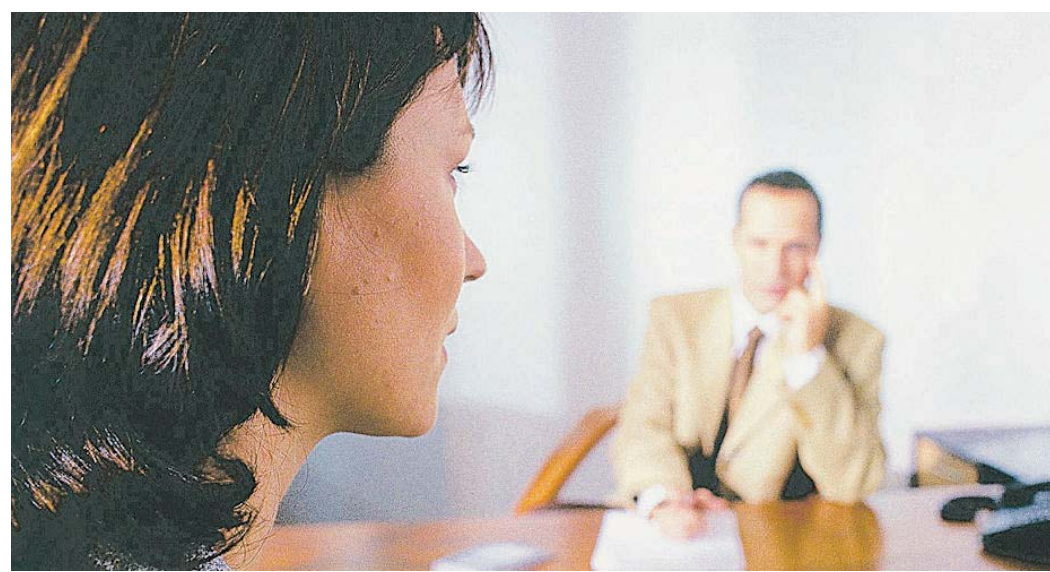
Auf ein Vorstellungsgespräch sollte man sich gründlich vorbereiten. Vor allem auf das richtige Auftreten kommt es dabei an.

Achten Sie bei Ihrer Bewerbung immer auf ein perfektes Äußeres. Ihr Anschreiben und Ihre Bewerbungsmappe ist Ihre erste persönliche Visitenkarte und gleichzeitig Ihre Eintrittskarte in das Unternehmen. Einige kleine Tipps hierzu: Schriftart Arial oder Times New Roman – Schriftgröße 10 oder 11, hochwertiges festes Papier, keine Plastikhüllen. Kopien mit schwarzem Rand sind ein absolutes Tabu. Machen Sie sich